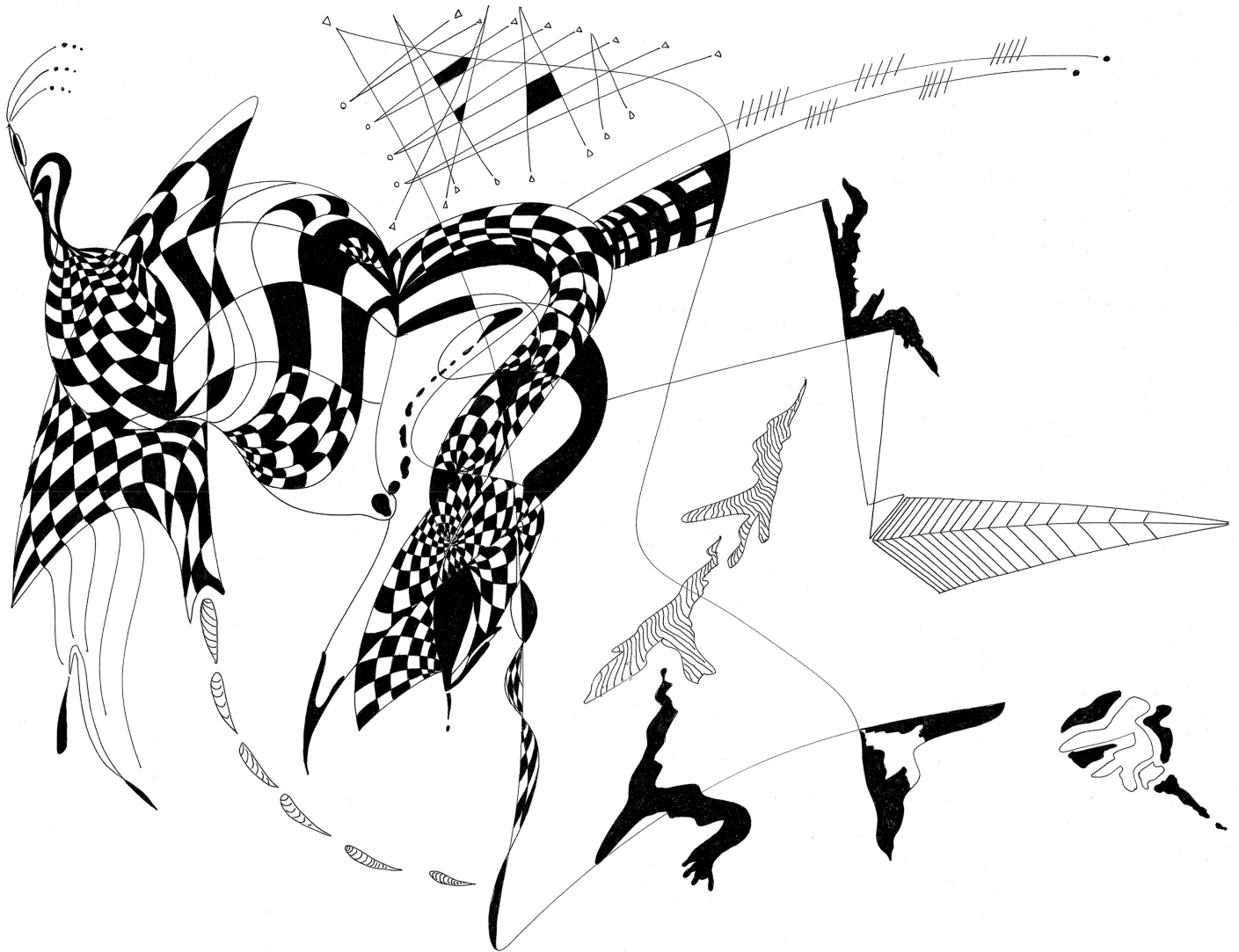
"Dimensions on space" ink on paper 40x60cm