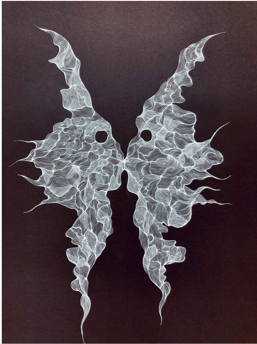
"What do you see?" ink on paper 113x73cm

La géométrie sacrée et les fractales sont ancrées dans le monde naturel qui nous entoure, dans les fleurs et les plantes que nous avons dans nos maisons et nos jardins et même dans les légumes que nous mangeons tous les jours.